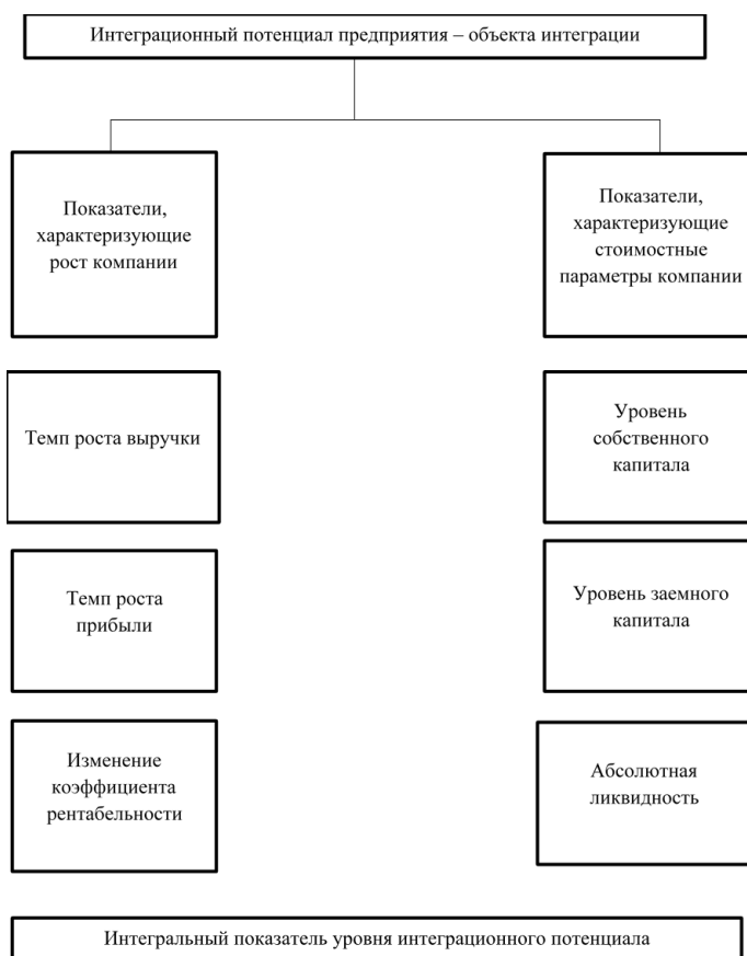
Рисунок 3. Интеграционный потенциал предприятия – объекта интеграции

Состав группы динамических показателей для оценки интеграционного потенциала включает в себя: