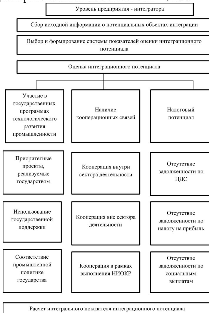
Рисунок 2. Характеристика интеграционного потенциала предприятия – интегратора

В таблице 1 систематизированы частные индикаторы, характеризующие интеграционный потенциал предприятия – интегратора. Итоговое значение по группе показателей определяется простым суммированием полученных значений. Устанавливается два варианта значения показателя – 0 и 1.