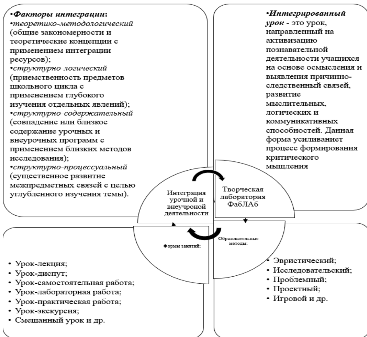
Рис.1 – Потенциал интеграции урочной и внеурочной деятельности по формированию критического мышления обучающихся