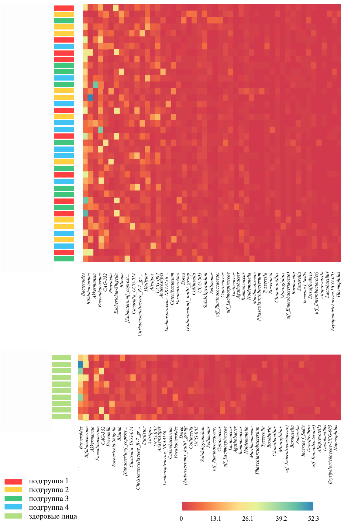
Рисунок 5 – Тепловые карты для проанализированных образцов кишечной микробиоты пациентов с СРК в зависимости от выделенных фенотипов и здоровых лиц на уровне рода кишечных бактерий. Примечание: цвет кодирует относительную представленность таксонов (столбцы) в образцах (строки)