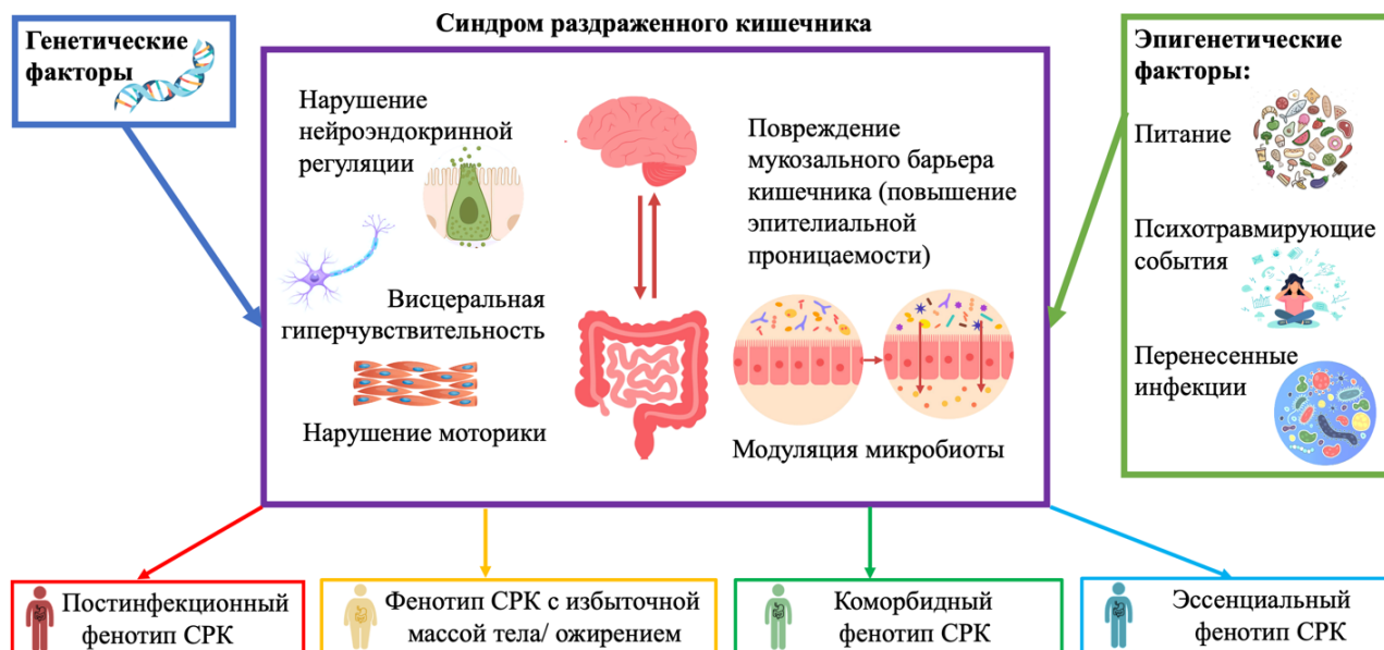
Рисунок 2 – Концепция фенотипирования СРК на основе взаимодействия генетических и эпигенетических факторов (личная концепция автора)

На заключительном этапе проведено открытое когортное проспективное рандомизированное исследование эффективности пациентоориентированных подходов к курации больных СРК на основе выделенных фенотипов заболевания (рисунок 3). Исследовательская когорта сформирована из 120 пациентов с СРК (по 30 в 4 группах соответственно выделенным фенотипам) в соответствии с критериями включения / невключения.