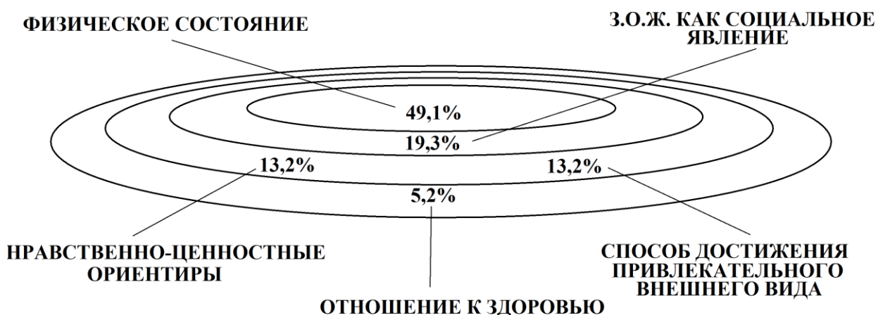
Рисунок 4 – Когнитивно-семантическое пространство концепта «Здоровый образ жизни» в молодёжных медиажурналах

активно пропагандируемого, модного, мотивирующего молодых людей и часто представленного в виде субкультуры. На третьем месте оказалась связь здорового образа жизни с нравственно-ценностными ориентирами молодёжи (ответственностью за свое здоровье и будущее, сознательностью, личностным выбором и др.), а также с возможностью улучшить свой внешний вид (похудеть, стать красивее, улучшить форму и др.). На последнем месте с точки зрения значимости находится группа признаков, указывающих на стремление сохранить или улучшить здоровье в целом (ЛСГ « Отношение к здоровью »). Таким образом, по результатам анализа медиадискурса, ведение здорового образа жизни осознается его субъектами 1) как совокупность действий, улучшающих физическое состояние; 2) как социальное явление, выступающее модным трендом; 3) как способ достижения желаемой внешности; 4) как особый нравственно-ценностный ориентир; 5) как совокупность действий, определяющих отношение человека к здоровью.