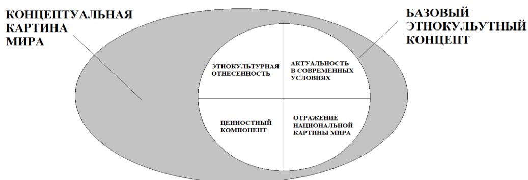
Рисунок 1 – Признаки базового этнокультурного концепта

лингвоконцептологии, выявляются его основные характеристики, представленные на рисунке 1: