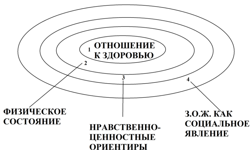
Рисунок 3 – Логико-понятийная структура концепта «Здоровый образ жизни»

нравственно-ценностные ориентиры, З.О.Ж. как социальное явление, так и соответствующими им дифференциальными признаками сохранение здоровья, улучшение здоровья; физические нагрузки, ежедневные действия, отказ от вредных привычек; нравственные ориентиры, ценностные ориентиры, индивидуальная сторона жизни; формирование и пропаганда З.О.Ж.