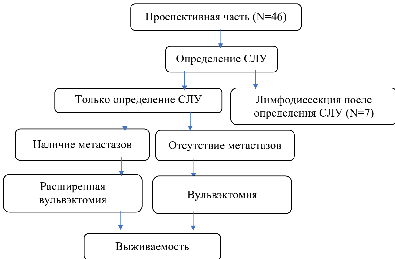
Рисунок 2. Дизайн исследования. Проспективная группа.

Проанализированы течение послеоперационного периода, осложнения, длительность хирургического вмешательства, сроки восстановления пациентов в зависимости от объема операции.