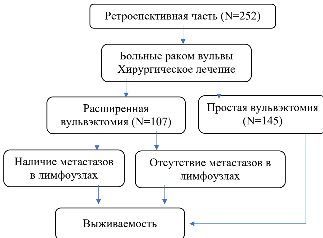
Рисунок 1. Дизайн исследования. Ретроспективная группа.

Для выполнения задач исследования была создана база данных, в которую включены клинико-морфологические характеристики больных, результаты дооперационного инструментального обследования, данные о хирургическом лечении и реабилитации пациентов. Дизайн исследования представлен на схеме (Рис. 1).